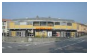
L'auditorium di Casatenovo

Ricomincia l'appuntamento settimanale del Cineforum al Cine-teatro Auditorium di Casatenovo. Per sei giovedì, a partire dal 10 gennaio, saranno proiettati film che avranno come leit motiv "La fabbrica dei sogni". Questo è stato infatti lo spunto per la scelta dei titoli in programma: lo statunitense "Little Miss Sunshine" , il fiabesco "Lady in the water" , "Inland empire" del regista David Lynch, già autore del celebre "Seven", il cartone animato giapponese "Il castello errante di Howl" , il coreano e drammatico "Soffio" ed infine "Noi Albinoi" , una produzione islandese, tedesca, britannica e danese.