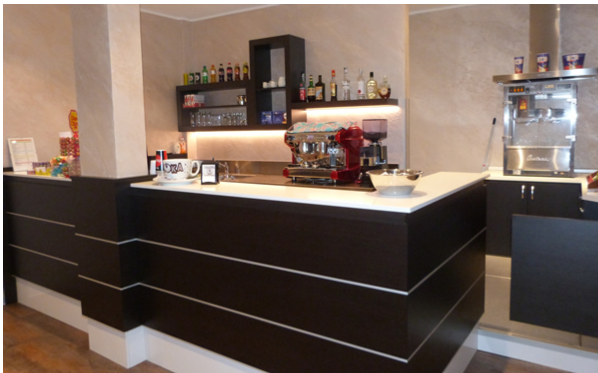
Il bar e sotto un'immagine di repertorio dei volontari

figuravano titoli come "Lungo duello", "Dove osano le aquile", "Avventure di Davj Crockett", "Fantasma pirata Barbanera" e l'appena uscito "2001 odissea nello spazio", capolavoro del maestro Stanley Kubrick. Non mancavano però gli eventi culturali, organizzati dal circolo Brianteo, mentre con il trascorrere degli anni anche la musica trovò posto nella grande sala parrocchiale di Casatenovo. Indimenticabile il concerto dei Pooh o le visite del "molleggiato" Adriano Celentano che proprio in Auditorium teneva le prove dei suoi "live".