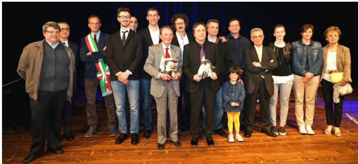
La cerimonia per il conferimento del Premio San Giorgio nel 2017 e sotto il recente concerto della Fanfara dei carabinieri