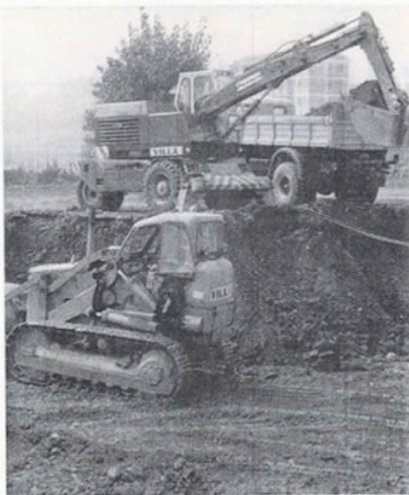
I primi scavi