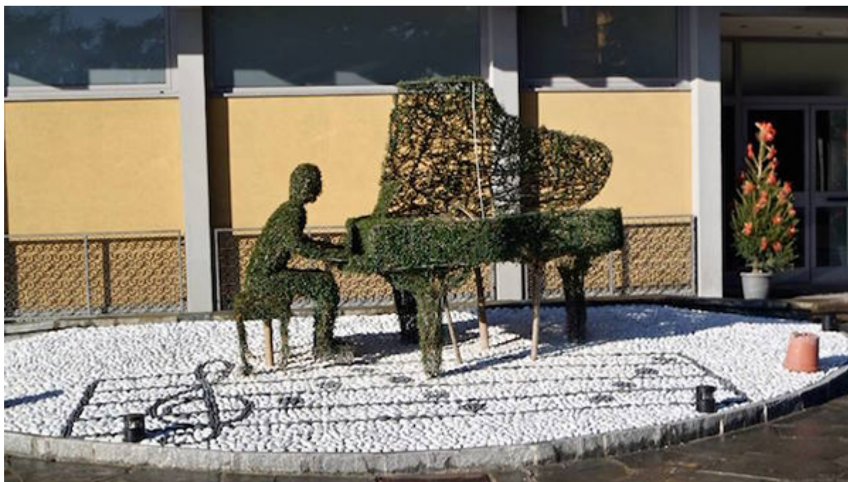
La scultura verde del pianista realizzata lo scorso anno all'ingresso della struttura e sotto a destra il vecchio listino prezzi per i biglietti