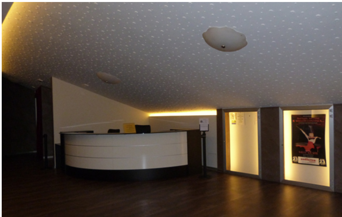
La hall come appare oggi

una funzione polivalente, potendo contare sulla presenza di un gruppo affiatato di volontari laici.