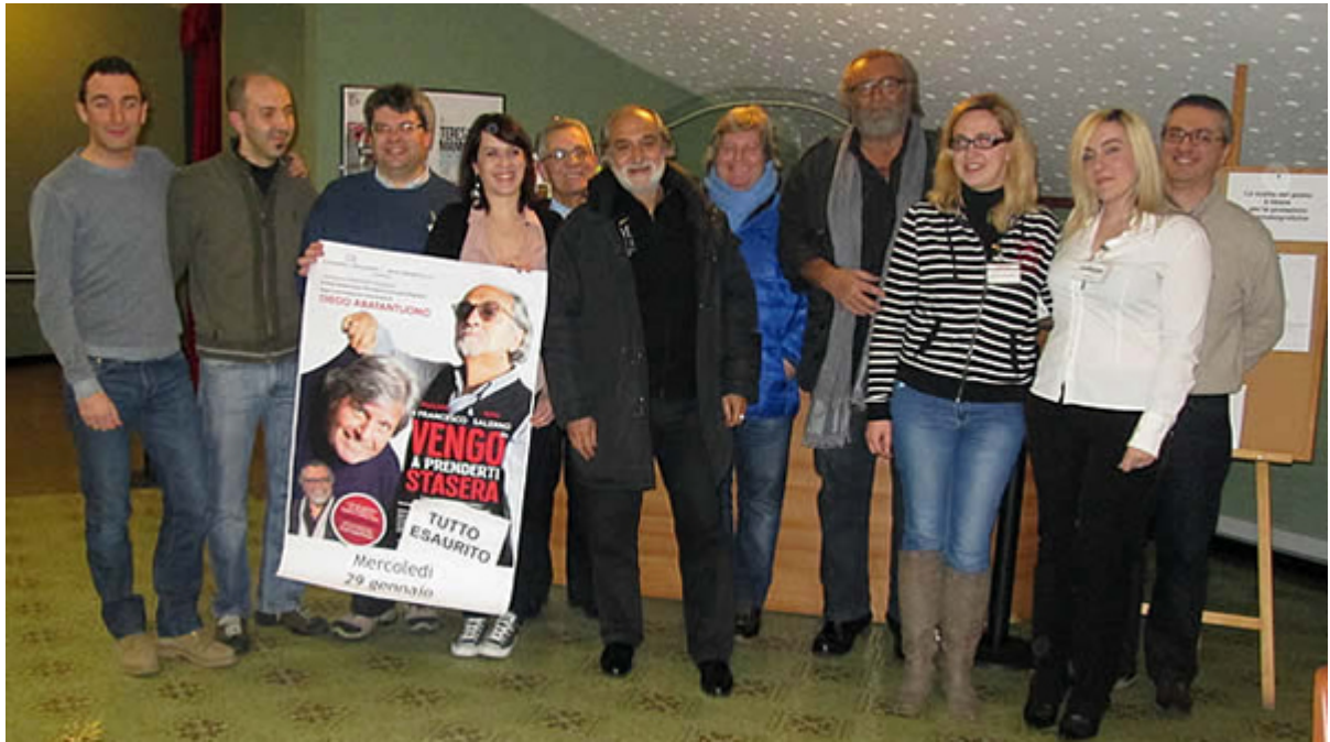
I volontari con Diego Abatantuono e Paolo Ferrari, due degli attori che hanno calcato il palco casatese