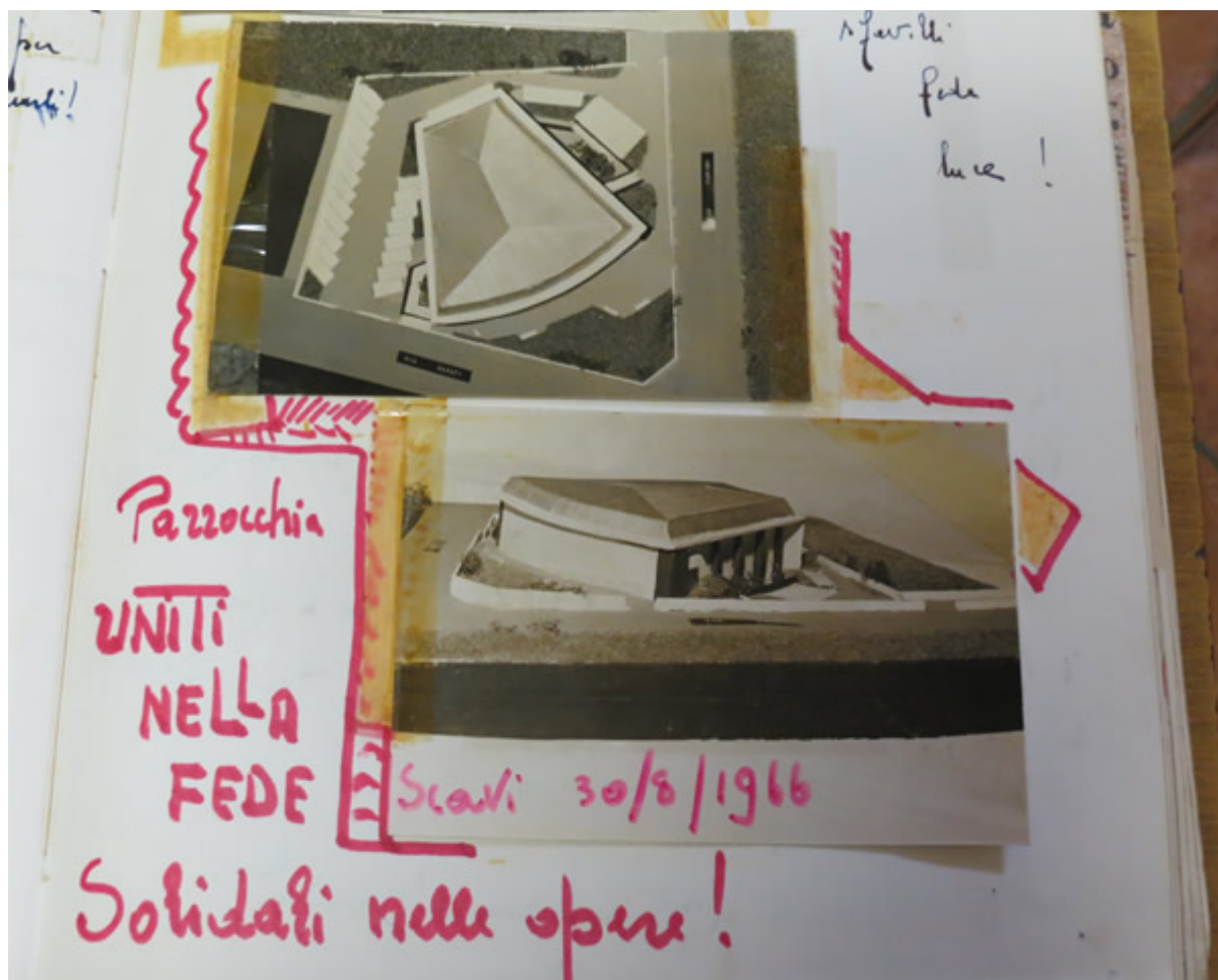
Altre immagini storiche relative ai progetti per l'Auditorium