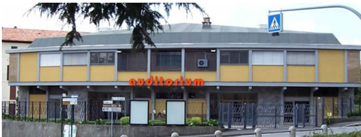
L'Auditorium di Casatenovo

L'Auditorium di Casatenovo si prepara a tagliare l'importante traguardo del mezzo secolo di vita.