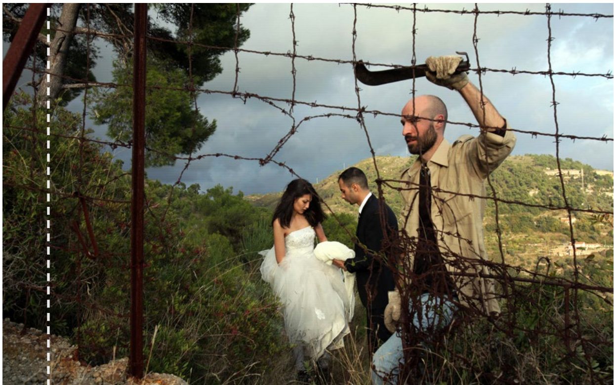
Gli sposi attraversano la frontiera tra Italia e Francia

Nelle ambasciate europee, il loro passaporto vale carta straccia. Così ogni mese, migliaia di siriani e palestinesi si affidano ai contrabbandieri libici ed egiziani, per attraversare il Mediterraneo su imbarcazioni di fortuna. Fuggono dalla guerra in Siria e vengono a chiedere asilo politico in Europa. L'Italia è solo un paese di transito, l'obiettivo è la Svezia. Dopo lo sbarco in Sicilia, il viaggio riprende da Milano, in macchina, di nuovo nelle mani dei contrabbandieri. Con le leggi sull'immigrazione in vigore, non c'è altra soluzione. A meno che a quelle leggi qualcuno non decida di disobbedire. Noi l'abbiamo fatto. E in questo film vi raccontiamo quello che ci è accaduto sulla strada da Milano a Stoccolma tra il 14 e il 18 novembre 2013.