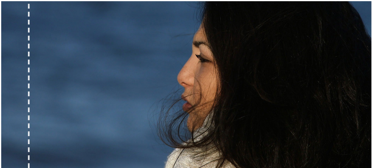
La sposa sulla spiaggia di Copenaghen, poco prima di passare l'ultima frontiera.

Per evitare di essere arrestati come contrabbandieri però, decidono di mettere in scena un finto matrimonio coinvolgendo un'amica palestinese che si travestirà da sposa, e una decina di amici italiani e siriani che si travestiranno da invitati.